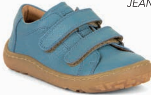
G3130240-1 * JEANS