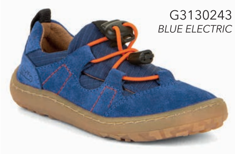
G3130243 BLUE ELECTRIC