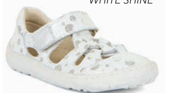
G3150262-9 WHITE SHINE