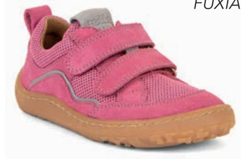
G3130246-3 FUXIA +