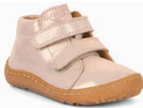
G2130323-7 NUDE +