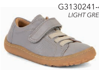
G3130241-4 LIGHT GREY