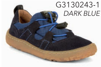
G3130243-1 DARK BLUE