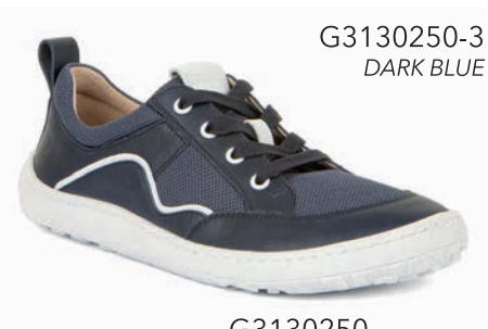
G3130250-3 DARK BLUE