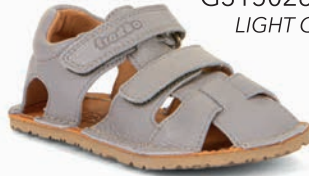
G3150263-4 LIGHT GREY