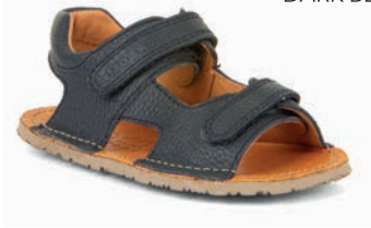
G3150268 DARK BLUE