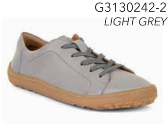
G3130242-2 LIGHT GREY