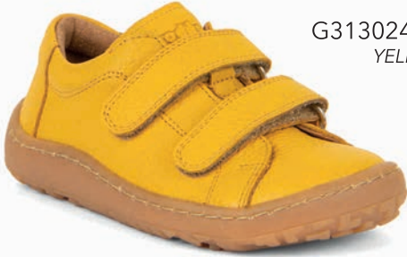
G3130240-6 * YELLOW