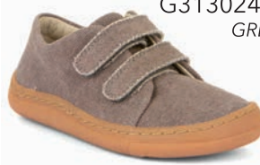
G3130248-2 GREY +