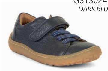
G3130241 DARK BLUE