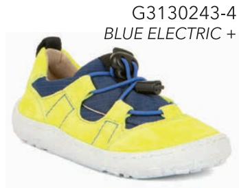
G3130243-4 BLUE ELECTRIC +