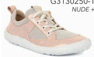
G3130250-1 NUDE +