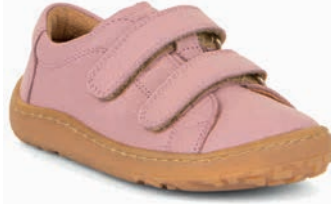
G3130240-8 * PINK