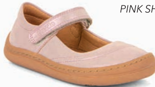
G3140184-4 PINK SHINE