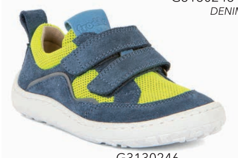
G3130246-18 DENIM +