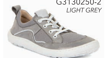
G3130250-2 LIGHT GREY