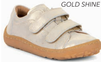
G3130240-11 GOLD SHINE