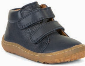
G2130323-8 DARK BLUE