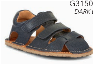
G3150263 DARK BLUE