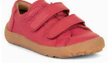
G3130240-5 * RED