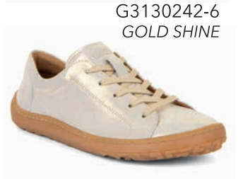
G3130242-6 GOLD SHINE