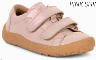
G3130240-10 PINK SHINE