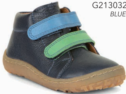
G2130323 BLUE +