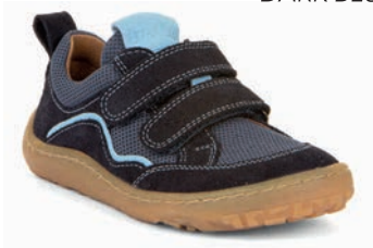
G3130246 DARK BLUE