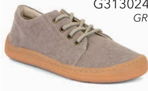
G3130249-2 GREY +