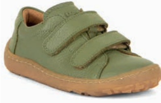
G3130240-3 * OLIVE