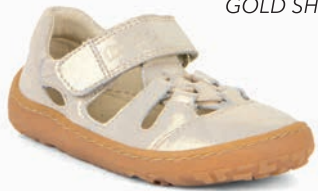
G3150262-4 GOLD SHINE