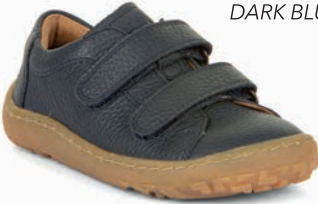
G3130240 * DARK BLUE