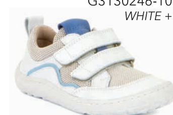
G3130246-10 WHITE +