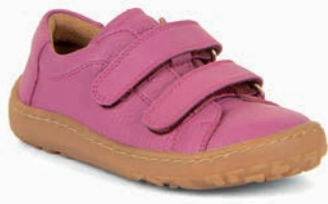
G3130240-7 * FUXIA