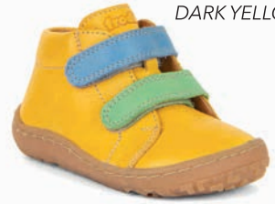
G2130323-3 DARK YELLOW