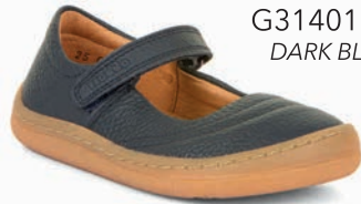
G3140184* DARK BLUE