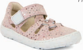
G3150262-7 PINK +