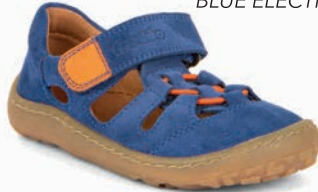
G3150262-1* BLUE ELECTRIC