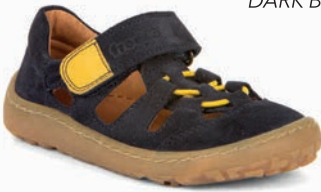
G3150262* DARK BLUE