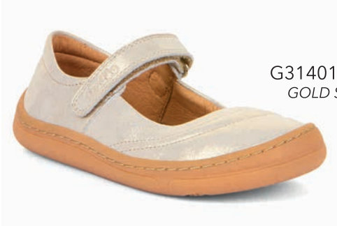
G3140184-5 GOLD SHINE