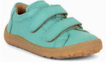
G3130240-9 * MINT