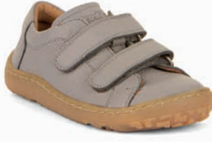
G3130240-4 * LIGHT GREY