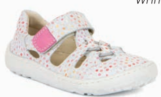
G3150262-8 WHITE +