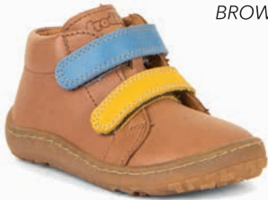
G2130323-1 BROWN +