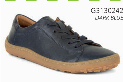
G3130242 DARK BLUE