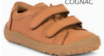
G3130240-2 * COGNAC